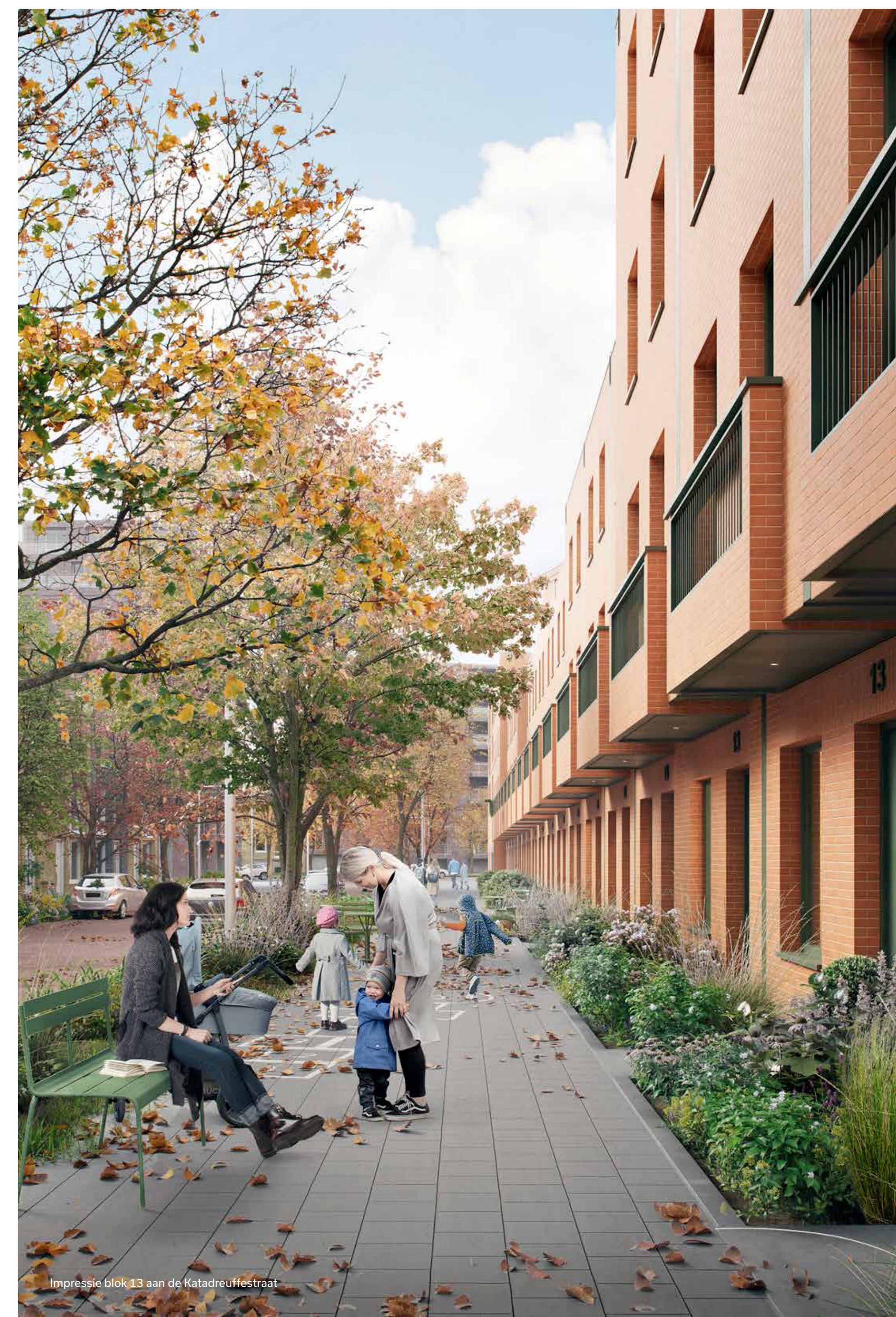
Impressie blok 13 aan de Katadreufsestraat

Aan de voorzijde hebben de woningen een eigen groene geveltuin die aansluit op de straat of het Dijkpark; een mooie overgang van privé naar openbaar terrein. Zo geniet je lekker op je eigen bankje van het uitzicht.