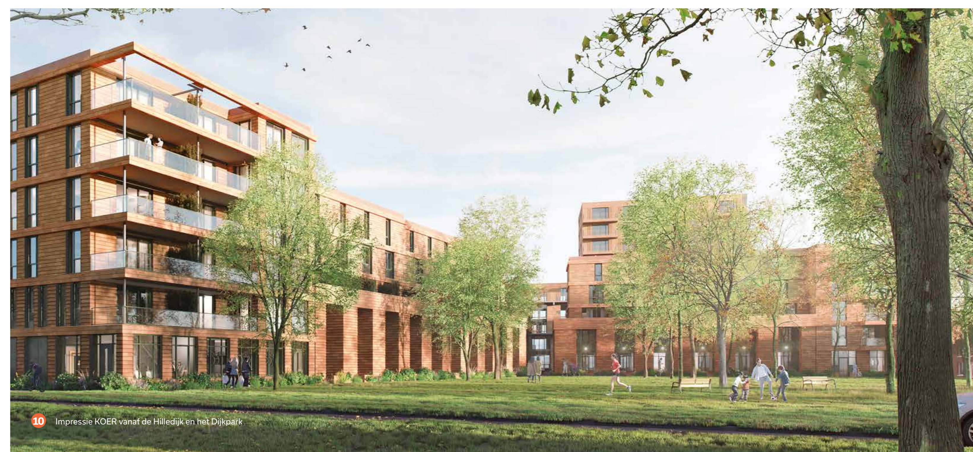
10 Impresie KOER vanaf de Hilledijk en het Dijkpark