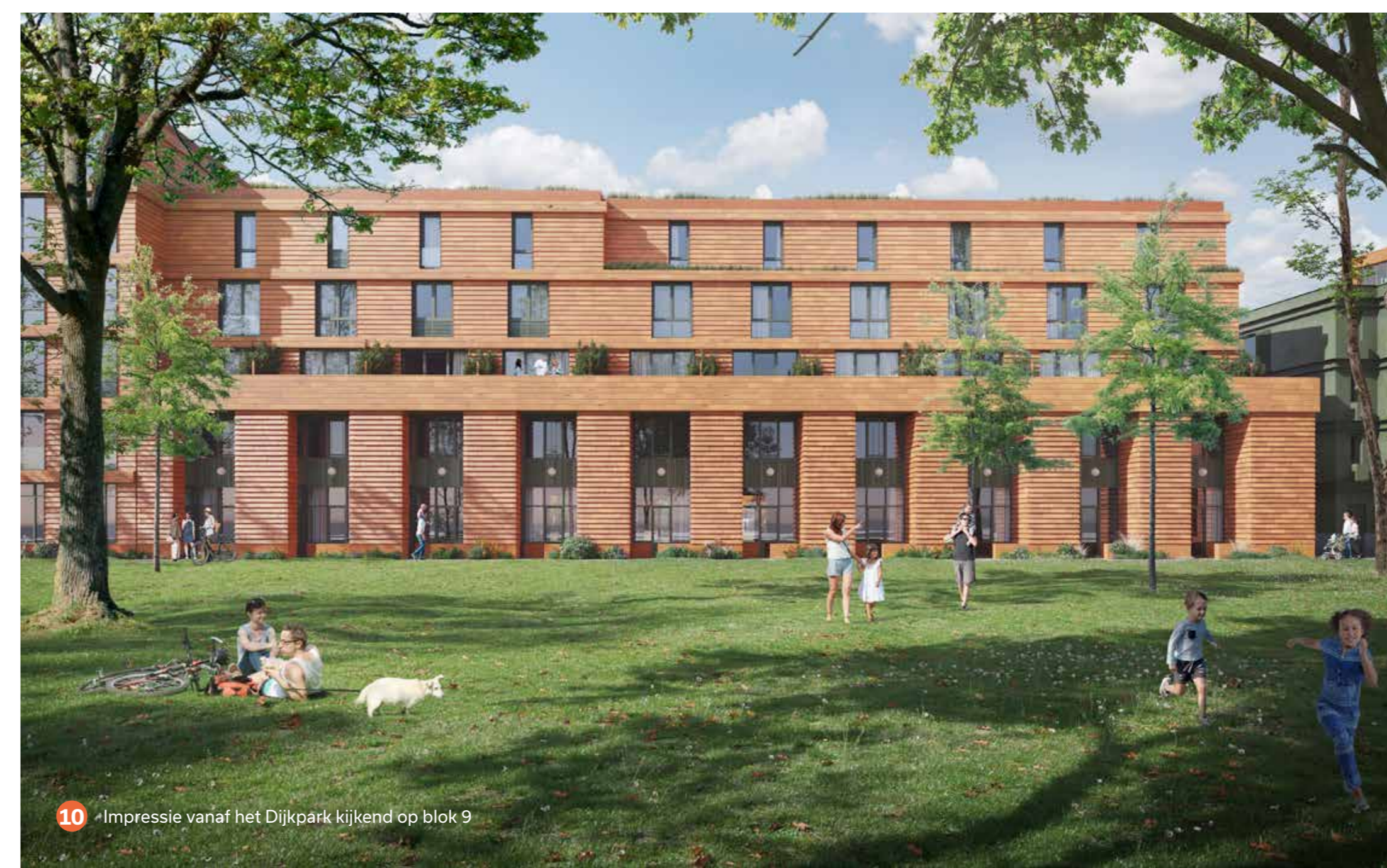
Impressie vanaf het Dijkpark kijkend op blok 9