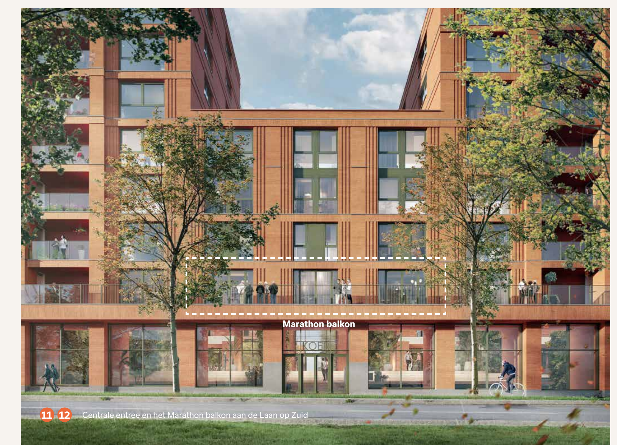
11 12 Centrale entree en het Marathon balkon aan de Laan op Zuid