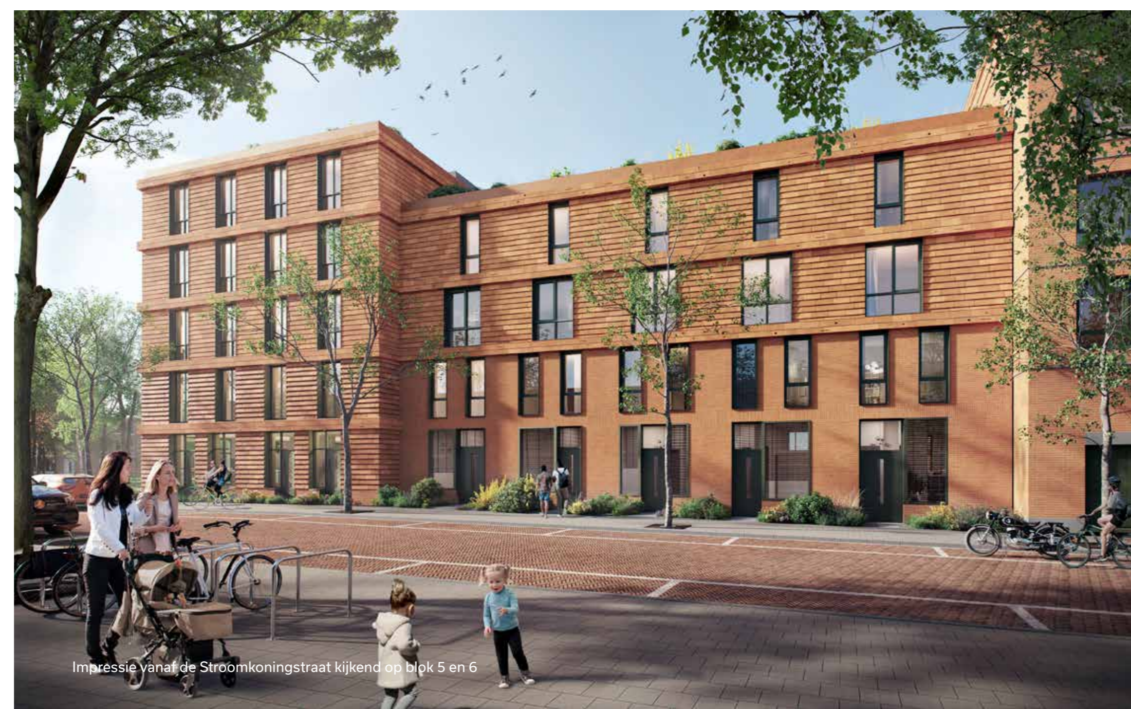
Impressie vanaf de Stroomkoningstraat kijkend op blok 5 en 6