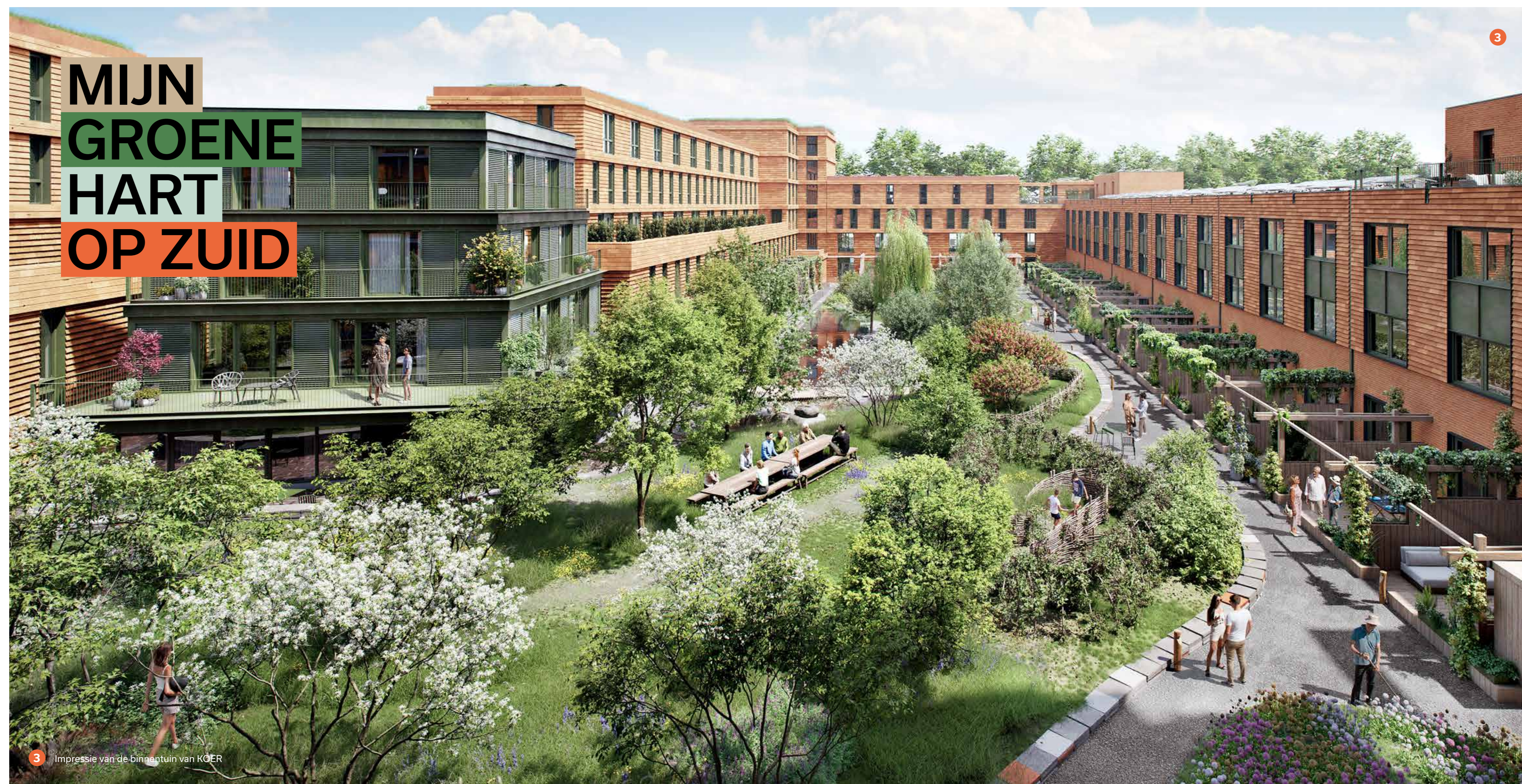
Impressie van de binnentuin van KOER

In KOER woon je natuurinclusief. Een mooie manier om te zeggen dat je omgeven bent door heel veel groen. En niet alleen om naar te kijken, maar vooral om gebruik van te maken. Om te spelen, te sporten en elkaar te ontmoeten voor een borrel of gezellige barbecue.