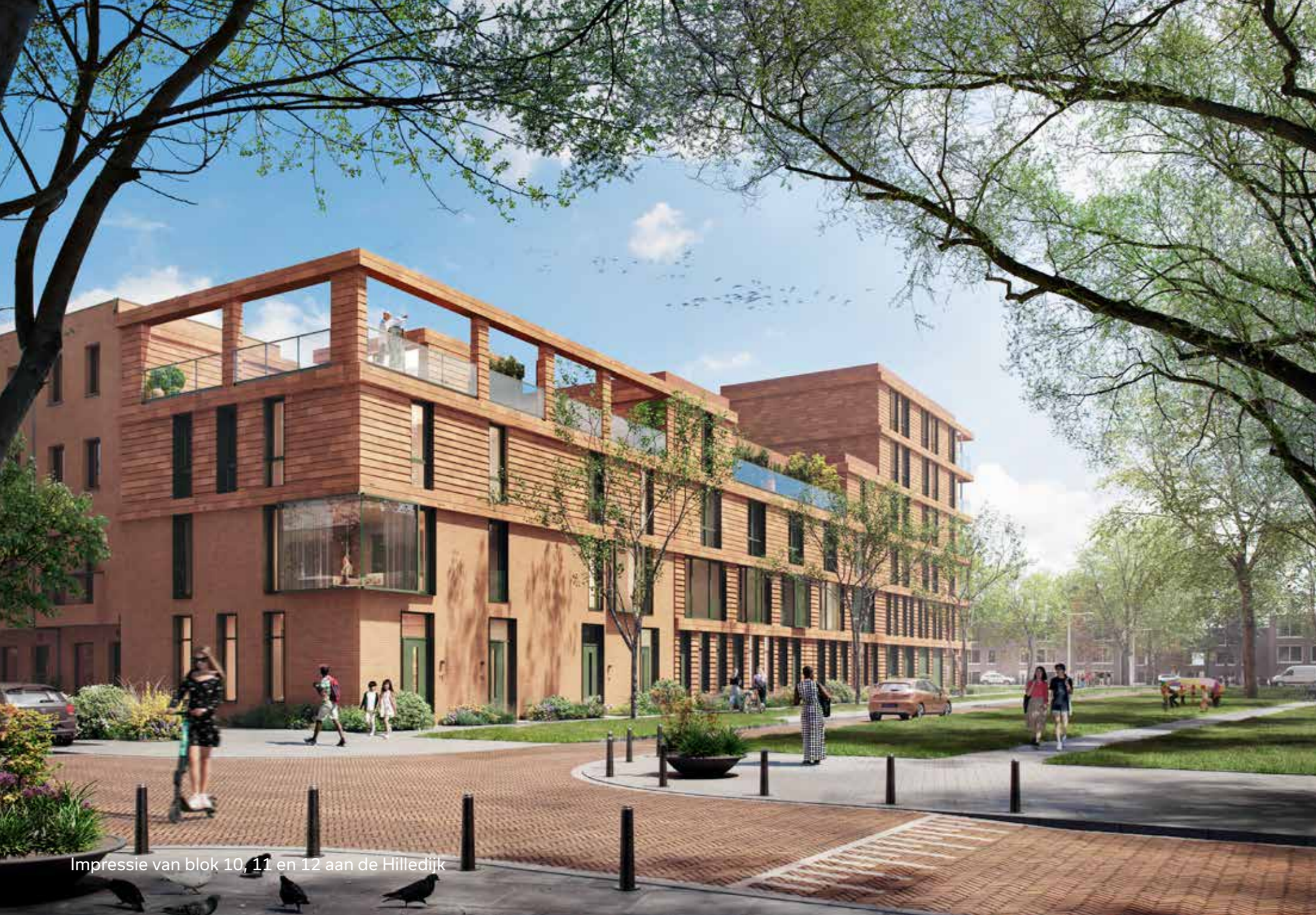
Impressie van blok 10