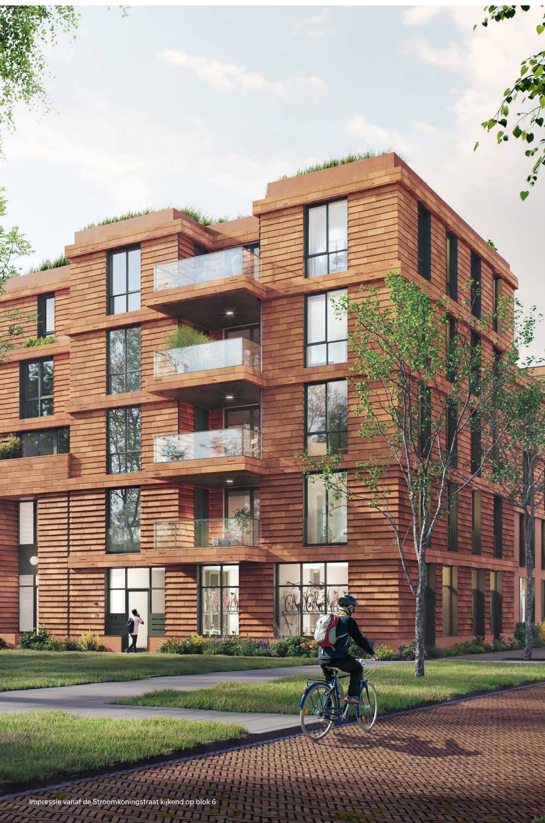
Impressie vanaf de Stroomkoningstraat kijkend op blok 6