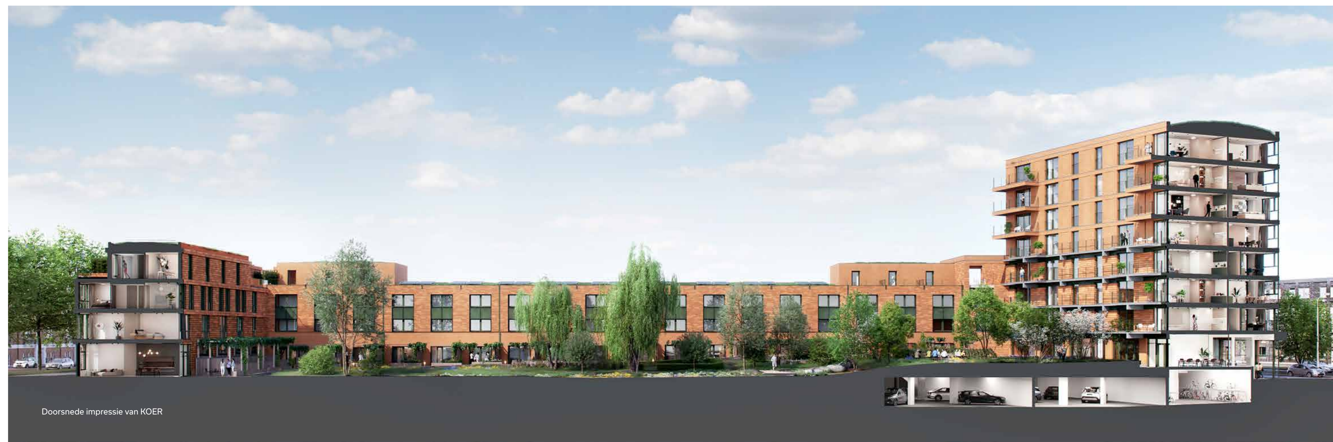
Doorsnede impressie van KOER